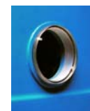
Mirilla de metacrilato