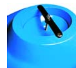
Boca de hombre elíptica