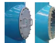
Boca de hombre lateral