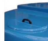
Boca de hombre