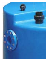
Conexiones con bridas o enlaces de PVC